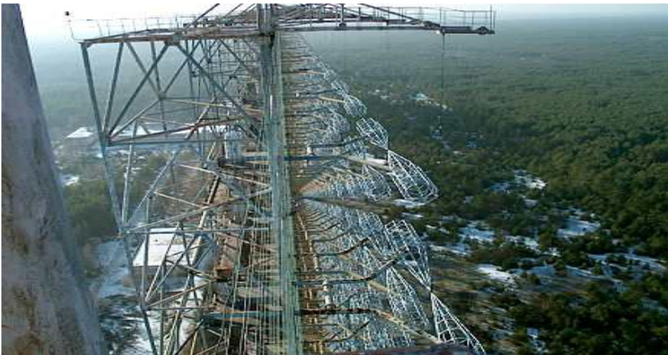
Woodpecker-Anlage in der Ukraine nahe Tschernobyl

Kam es am 26. April 1986 im Atomkraftwerk Tschernobyl (Ukraine) zu einem schweren Unfall? Trifft es zu, dass der Hergang des Unfalls bis heute nicht zweifelsfrei geklärt ist? Befindet sich bzw. befand sich in der Nähe des Atomreaktors von Tschernobyl die so genannte Woodpecker-Anlage (Woodpecker ist der englische Begriff für Specht)? Wurde die Woodpecker-Anlage durch das Atomkraftwerk von Tschernobyl mit Energie versorgt?