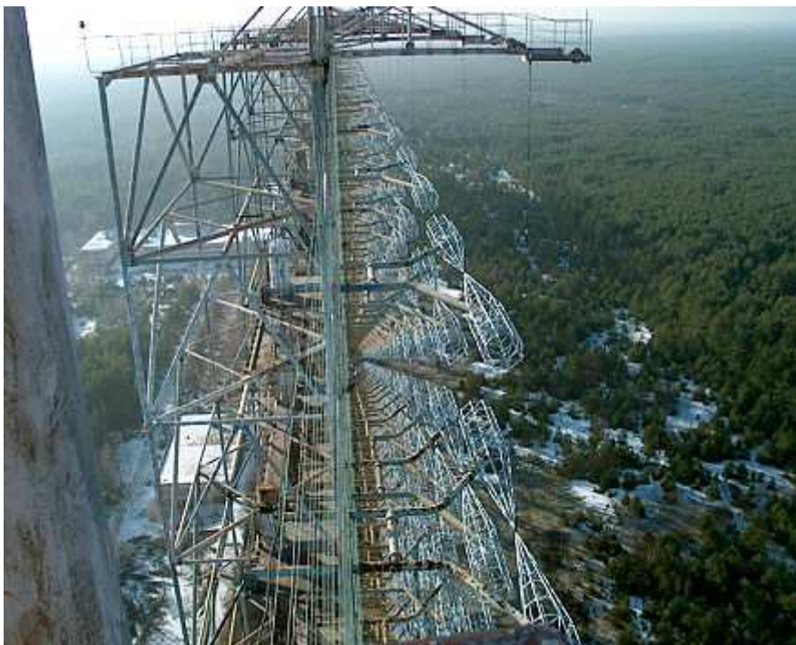
Woodpecker-Anlage in der Ukraine nahe Tschernobyl

Kam es am 26. April 1986 im Atomkraftwerk Tschernobyl (Ukraine) zu einem schweren Unfall? Trifft es zu, dass der Hergang des Unfalls bis heute nicht zweifelsfrei geklärt ist? Befindet sich bzw. befand sich in der Nähe des Atomreaktors von Tschernobyl die so genannte Woodpecker-Anlage (Woodpecker ist der englische Begriff für Specht)? Wurde die Woodpecker-Anlage durch das Atomkraftwerk von Tschernobyl mit Energie versorgt?