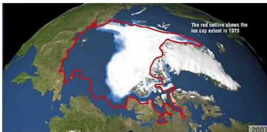
NASA-Darstellung des arktischen Eises im Jahr 2007 (weiße Fläche) und im Jahr 1979 (rote Linie)

Hat sich die Arktis seit den 1970er Jahren bis heute erwärmt? Ist das Eis der Arktis seit den 1970er Jahren bis heute stark zurückgegangen? Hat sich die Arktis stärker erwärmt als andere Regionen der Erde? Entstehen durch Schmelzen des polaren Eises entlang Alaska bzw. Sibirien für die Schifffahrt neue, bislang nicht verfügbare Routen? Wird die Route entlang Alaska Nord-West-Route genannt? Sind diese neuen Schifffahrtsrouten für bedeutende Ziele wesentlich kürzer als die durch Panama- oder Suez-Kanal?